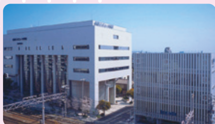
京都コンピュータ学院